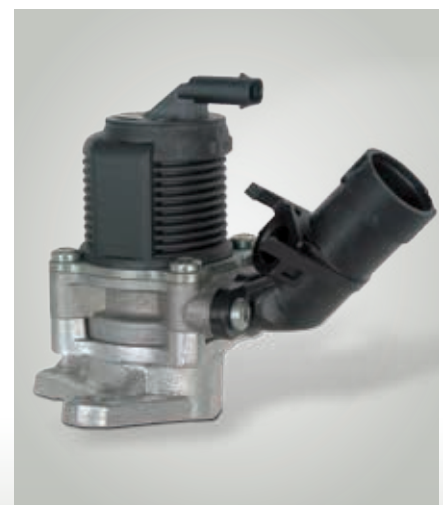
Válvula de conmutación eléctrica (desde aprox. 2007)