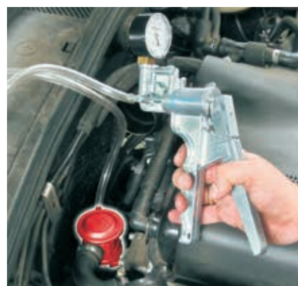
Comprobar una válvula de aire secundario con una bomba manual de depresión