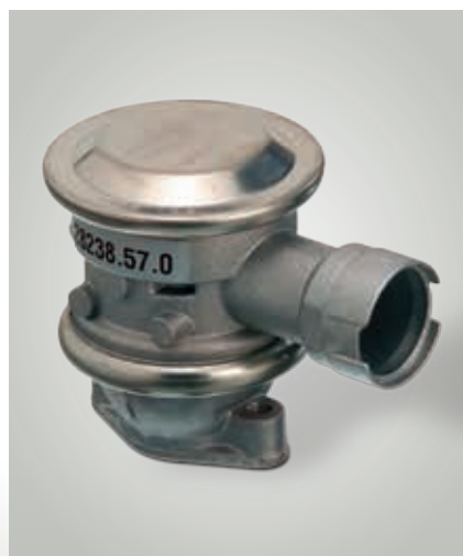
Válvula de retención desconectable, controlada por presión (desde aprox. 1998)