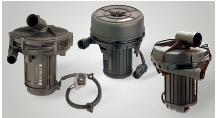
Diversas bombas de aire secundario de las generaciones 1 y 2

Para el control por parte del On-Board-Diagnose (OBD) las válvulas eléctricas de aire secundario puede estar equipadas con un sensor de presión integrado.