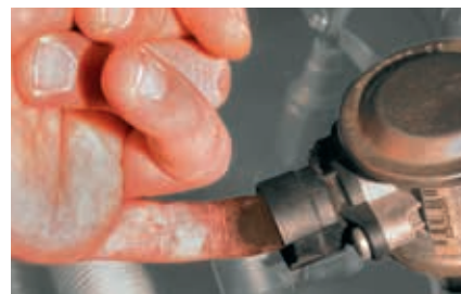
“Prueba del dedo” en la válvula de aire secundario en el BMW 520i (destacada) Si en este lado hay sedimentaciones, la válvula de retención es inestanca y se ha de renovar.