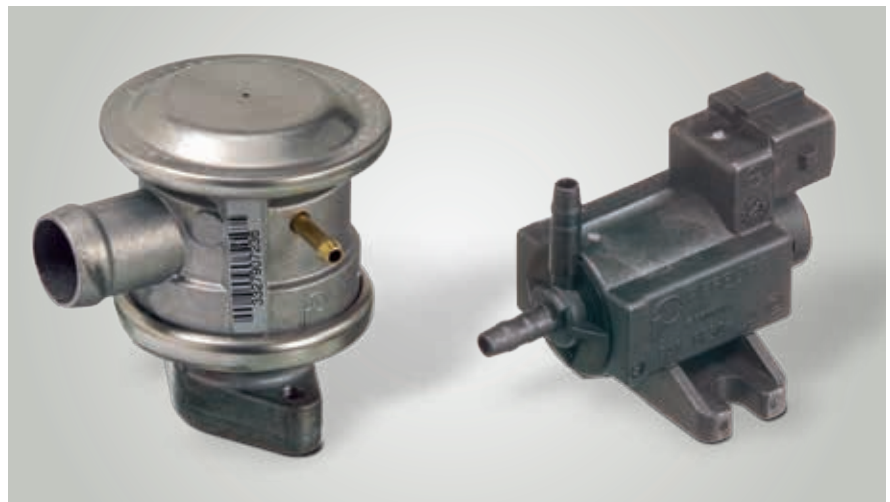
Válvula de retención y de corte controlada por depresión (desde aprox. 1995) y válvula eléctrica de conmutación