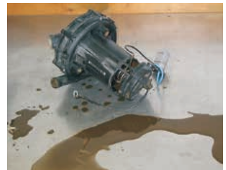
Condensado de gases de escape líquido de una bomba de aire secundario