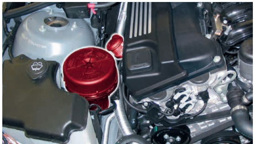
Válvula de aire secundario y bomba de aire secundario en el BMW E46 (destacado)