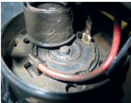
Condensado de gases de escape agresivo en el motor de accionamiento de una bomba de aire secundario

Si la aspiración del aire secundario no se efectúa en el tracto de aspiración, sino directamente del vano motor, se encuentra un filtro de aire separado delante de la bomba de aire secundario que puede estar obstruido.