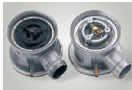
Válvula de aire secundario abierta izquierda: daños por condensado de gases de escape, derecho: estado nuevo