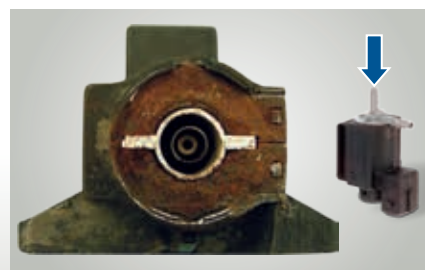
Válvula de conmutación eléctrica corroída (abierta)