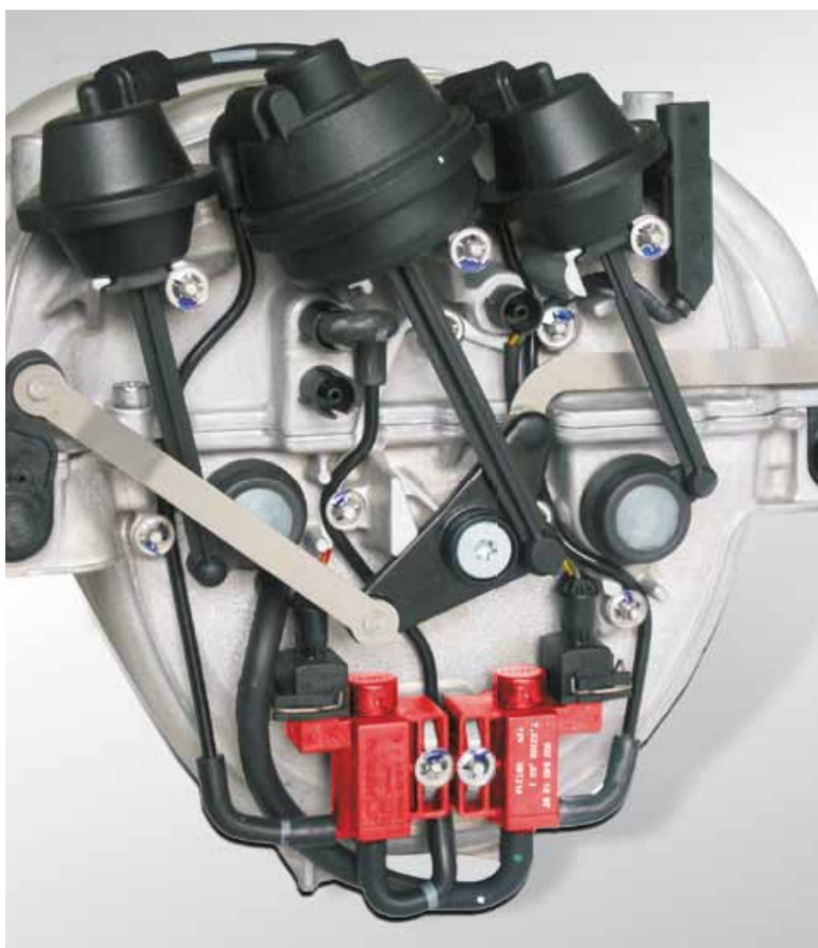
Exemple d'application : tubulure d'aspiration à résonance avec soupapes électropneumatiques (signalées en rouge) dans la Mercedes Classe C

Ces soupapes existent dans différentes exécutions et sous différentes désignations (cf. Info page 4). Les types les plus courants de ces soupapes sont mentionnés sur les pages suivantes.