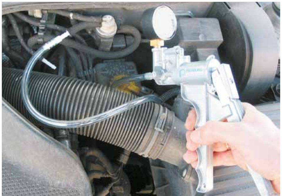
Contrôle d'une EPW avec la pompe à dépression manuelle (VW Golf IV)

C'est pourquoi il est recommandé ici de faire appel à un spécialiste possédant des connaissances de système et qui ne se