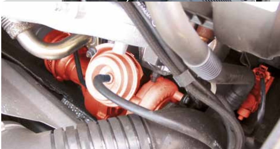
EPW et compresseur VTG (signalé en rouge) dans une Audi A4 TDI