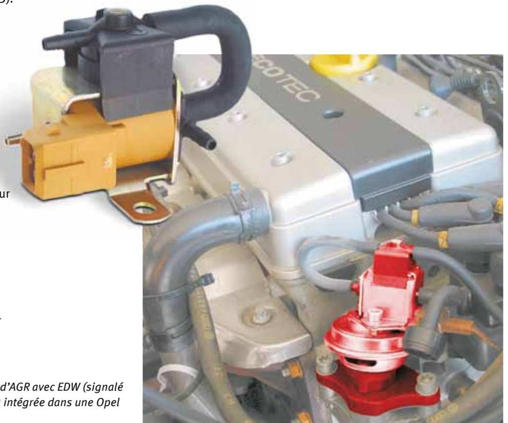
Soupape d'AGR avec EDW (signalé en rouge) intégrée dans une Opel Astra

Le limiteur de pression engendre une dépression pratiquement constante. La EUV intégrée est excitée par une « modulation d'impulsions en largeur » depuis le calculateur moteur et régule ainsi, par ex., une soupape d'AGR pneumatique.