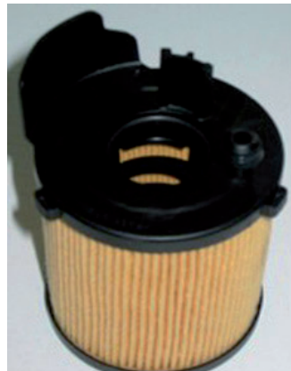
Figure 2 : réplique d'un concurrent

Lors du remplacement des cartouches filtrantes, il est important d'utiliser une OX 171/2 D Eco ou une OX 171/16 D Eco MAHLE Original ou Knecht, car ce sont les seules à répondre aux fortes exigences de l'équipement d'origine (goupille et ajustement exact).