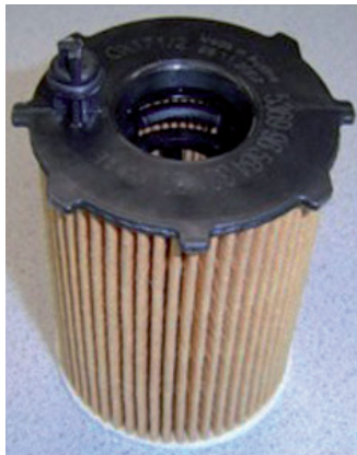
Figure 1 : MAHLE OX 171/2 D Eco

Depuis plusieurs années, MAHLE propose pour la production en série les OX 171/2 D Eco et les OX 171/16 D (cette dernière venant d'être référencée à l'Aftermarket). Ces cartouches filtrantes équipent de nombreux modèles à moteur diesel 1,4 L et 1,6 L (OX 171/2) de plusieurs constructeurs dont Citroën, Peugeot, Mazda et Volvo, ainsi que la Fiat 500 Twin Air (OX 171/16). Elles sont équipées de la goupille brevetée MAHLE et sont dimensionnées précisément pour correspondre à la géométrie du boîtier de filtre à huile.