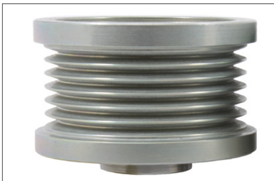
Photo 2: poulie à roue libre d'alternateur INA réf. 535 0202 10 à 6 gorges

Pour tous les modèles, Schaeffler Automotive Aftermarket propose la poulie à roue libre d'alternateur pour courroie poly V à 6 rainures réf. 535 0202 10 (photo 2). Cette dernière peut également être utilisée sans problème pour les alternateurs avec courroies poly V à 5 rainures.