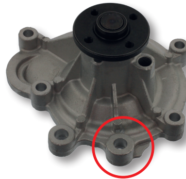
Neue Version New version