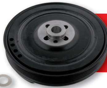
Rep. Satz Riemenscheibe