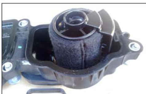
Ancien type de reniflard