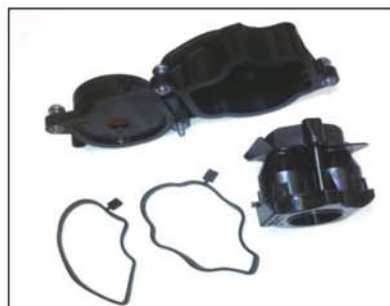
Nouveau type de reniflard