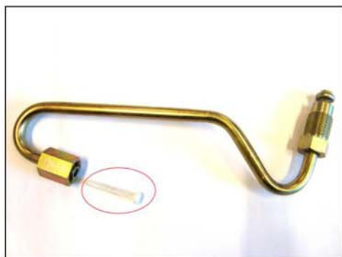
Tuyau de graissage avec filtre