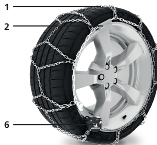
AUTOMATIC SNOW CHAINS