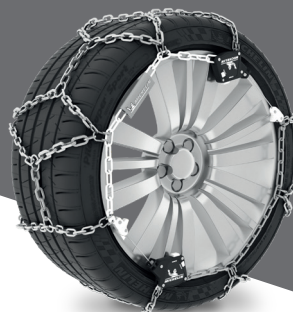
AUTOMATIC SNOW CHAINS SUV - 4X4 - UTILITY - CAMPING CAR