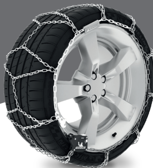
AUTOMATIC SNOW CHAINS